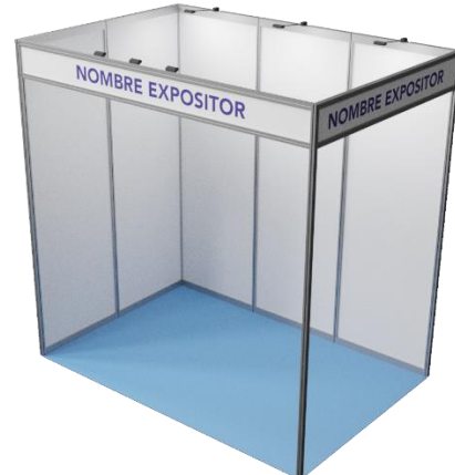
TAMAÑO / SIZE: 3 x 2 x 2,98 m en esquina / on corner Imagen orientativa. Illustrative image.